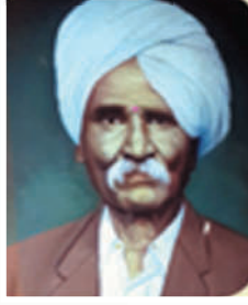
कै. रामचंद्र लक्ष्मण फाळके